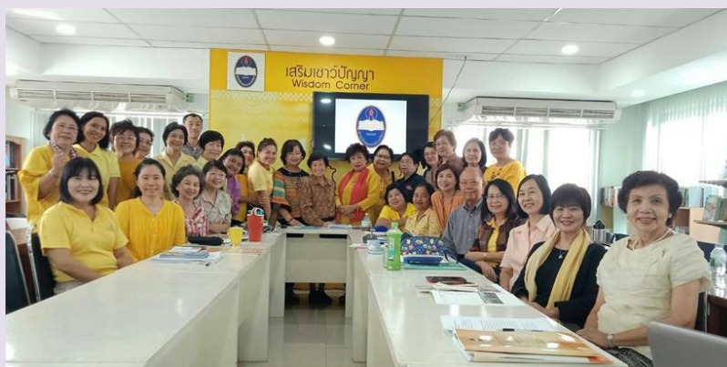
คณะกรรมการบริหารชุดเก่า (ชุดที่ 37) ส่งมอบงานให้คณะกรรมการบริหารชุดใหม่ (ชุดที่ 38)